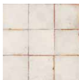
20527 FS MIRABEL-B BN14 (33x33) (5-2-H)**** CLASE 2 R-10 4 gráficas/patterns