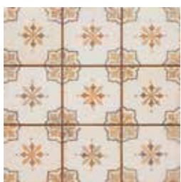
20301 FS MIRABEL-M BN14 (33x33) (5-2-H)**** CLASE 2 R-10 4 gráficas/patterns