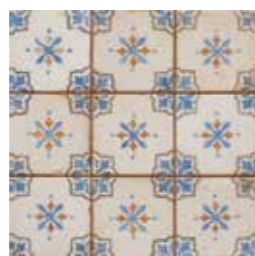
20300 FS MIRABEL-A BN14 (33x33) (5-2-H)**** CLASE 2 R-10 4 gráficas/patterns